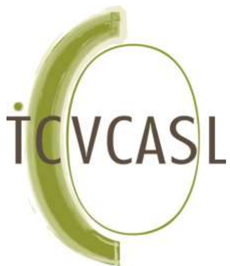
TABLE DE CONCERTATION EN VIOLENCE CONJUGALE ET AGRESSIONS À CARACTÈRE SEXUEL DE LAVAL